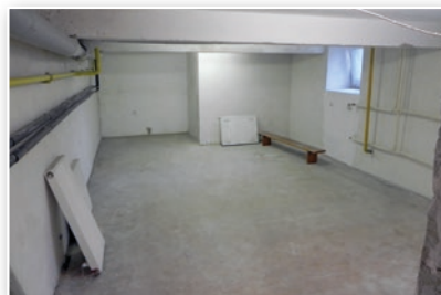
Šatny ZŠ Bukovec - během rekonstrukce