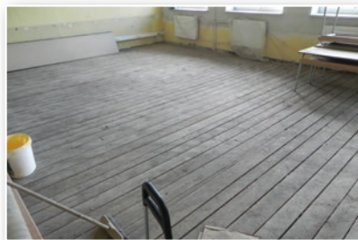
Učebna ZŠ Bukovec - během rekonstrukce