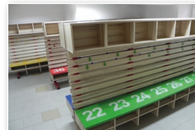
Šatny ZŠ Bukovec - po rekonstrukci