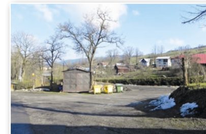
Prostranství plánované aut. točny "Pod Lipou"