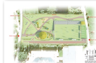
Navrhovaná studie hřiště nad školou 2