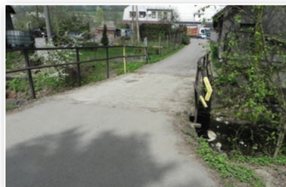
Oprava mostku U Turka - původní stav