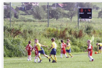
Fotbalové hřiště TJ Beskyd Bukovec