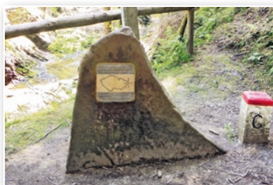
Nejvýchodnější bod ČR

Již zmíněné nové webové stránky budou odpovídat dnešním trendům, jejich moderní aplikace zaručí lepší informovanost i orientaci turistů a návštěvníků v naší obci.