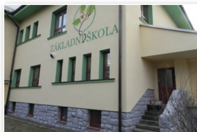
ZŠ a MŠ Bukovec - po rekonstrukci