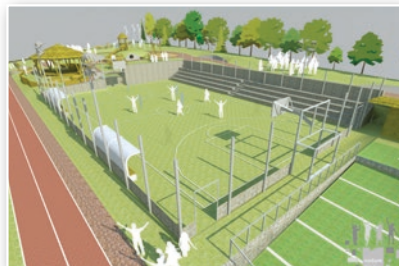
Navrhovaná studie hřiště nad školou