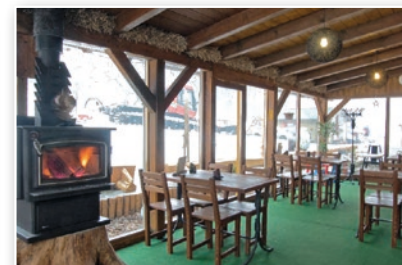
Bar pod Kypóm v areálu Kempaland