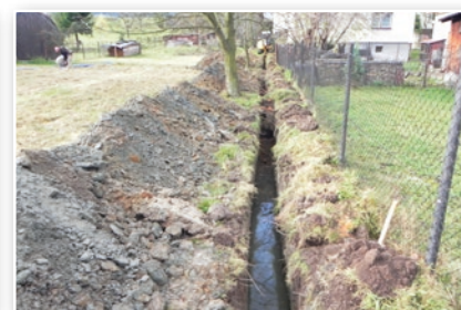
Nová větev vodovodního řádu v lokalitě Blažky