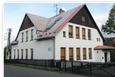
ZŠ s polským jazykem vyučovacím - původní stav