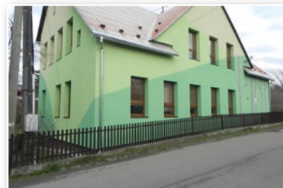
ZŠ s polským jazykem vyučovacím - po rekonstrukci