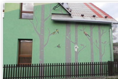
ZŠ s polským jazykem vyučovacím - po rekonstrukci