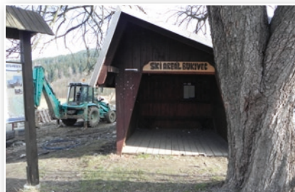
Zastávka Ski areál - Kempalandský - původní stav