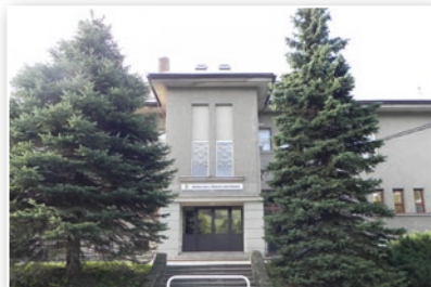
ZŠ a MŠ Bukovec - původní stav