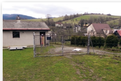
Oplocení kolem hřbitova a márnice - současný stav

V rámci ochrany životního prostředí je v zájmu obce revitalizovat čistírny odpadních vod u základních škol a napojit na ně i okolní rodinné domy , vybudovat kanalizační sítě ve vymezených zájmových lokalitách, popř. poskytovat příspěvky na výstavbu domovních čistíren.