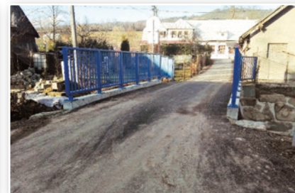
Oprava mostku U Turka - současný stav