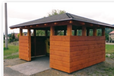
Přístřešky na kontejnery tříděného odpadu