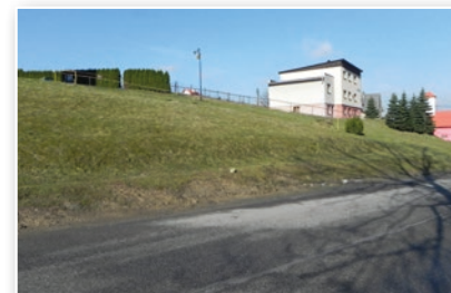
Prostranství plánovaného parkoviště pod kostelem