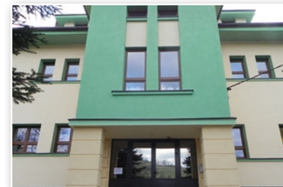
ZŠ a MŠ Bukovec - po rekonstrukci