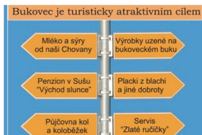
Možnosti podnikatelských aktivit :-)