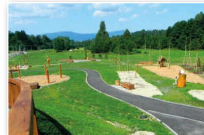
Turistická atrakce Cestujeme po Evropě