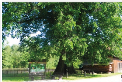
Největší a nejstarší jilm v ČR