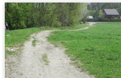
Chodník Kučery - Turek současný stav

*Poznámka: shodné pořadí – shodný počet obdržených hlasů zastupitelů