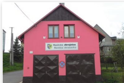
Požární zbrojnice - současný stav

Naším zájmem rovněž je přispívat ke vzdělávání i osvětě občanů všech věkových kategorií formou veřejných přednášek a besed , pokračovat v kulturním odkazu svých