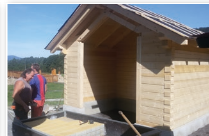
Zastávka Ski areál - Kempalandský - nová zastávka