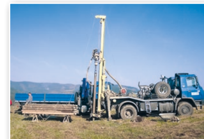
Hydrogeologický vrt na Kypě